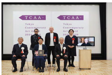
5. Tokyo Contemporary Art Award 2024-2026 授賞式の様子

第5回受賞記念展を2025年12月末より開催します。 会期：2025年12月25日（木）～2026年3月29日（日） 会場：東京都現代美術館 企画展示室3F（東京都江東区三好4-1-1）