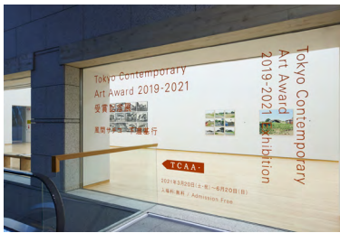
1. 「Tokyo Contemporary Art Award 2019-2021 受賞記念展」展示風景（東京都現代美術館、2021）