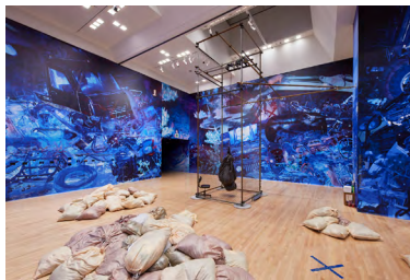
3. 志賀理江子 《あの夜のつながるところ》2022