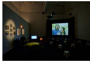
2. 山城知佳子 《チンビン・ウェスタン 家族の表象》2019