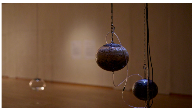
3. 梅田哲也 《Watering/水道》2025