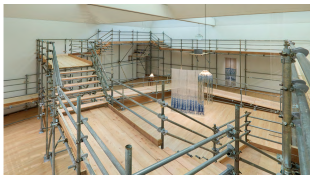
2. 「Tokyo Contemporary Art Award 2024-2026 受賞記念展『湿地』」展示風景（東京都現代美術館、2025）