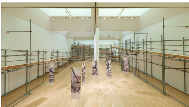
1. 「Tokyo Contemporary Art Award 2024-2026 受賞記念展『湿地』」展示風景（東京都現代美術館、2025）