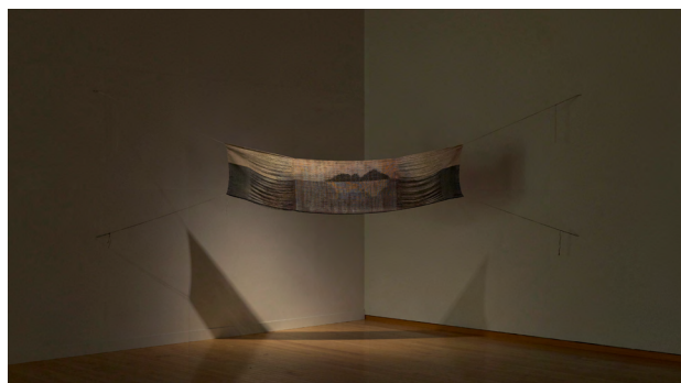
6. 呉夏枝 《海図》2017