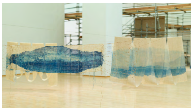
8. 呉夏枝 左：《椿の咲くところ》2025 / 右：《海女の道》2025