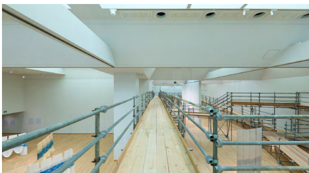
5. 梅田哲也 《Watering/水道》2025