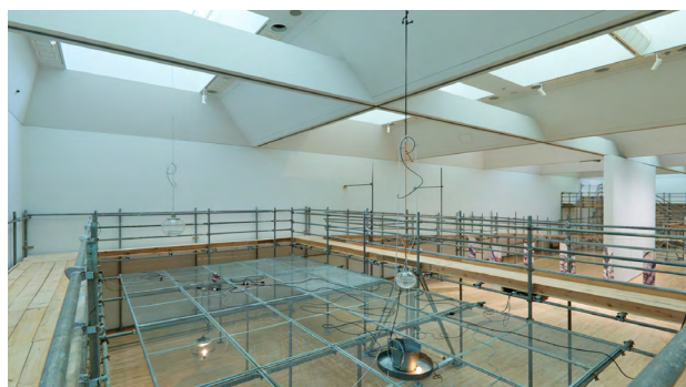
4. 梅田哲也 《Watering/水道》2025