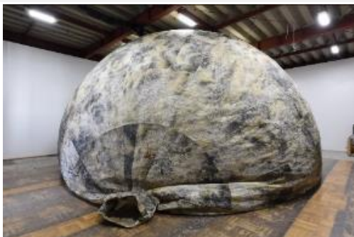
5. 《地面のためいき》 2022、インスタレーション

戦時中に日本がアメリカを攻撃するため放った「風船爆弾」について、昨年その着地点のひとつをグーグルマップと米軍の文書記録から特定できました。そして、TCAA の渡航支援でワシントン州ハンフォード・サイト近くのその場所へ行きました。2022 年 9 月には、風船を放った場所のひとつである福島県いわき市で、美術館や博物館において市民の皆さんと歴史を探る散策会をしてもらいました。海を隔てた人たちとのコミュニケーション手段が発達しても、人類は兵士や爆弾を送ることを止めないことが、連日の報道で伝えられています。いま、かつて風船が飛来した地面を想像して絵を描いています。