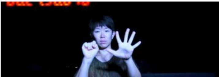
1. 《バイポーラー》よりスチル画像 2022

制作の土台として、この2年間、宮城県美里町にあるスタジオにてさまざまな方を招き、トーク、レクチャー、ワークショップを行ってきました。生活の場でもある制作場所を開くことで、実にさまざまな体験に恵まれ、想像すらしなかった新たな出会いが沢山ありました。その経験は、2011年の震災後、大きな資本と抗うことが困難な国家の計画に圧倒され続けた、この12年間の復興を、近代の抑圧としてだけ考えるのではなく、どこかではこれまでとは違う角度から考える発想や、さまざまな道、もしくは拮抗するような力が生まれ、それぞれが密につながる可能性があるという可能性を示唆する営みでもありました。この自らの体ひとつを鏡のようにして、この時間に起こった出来事の蓄積から、展示室へ照らし返すような展示ができればと思っています。