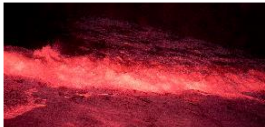
2. 《バイポーラー》よりスチル画像 2022