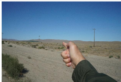
6. 《シューティング（コールドクリーク）》 2022、写真