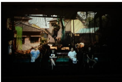
7. 《三函座の解体》 2013、映像インスタレーション、33 分 23 秒