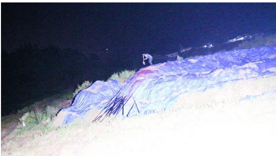
3. 《バイポーラー》よりスチル画像 2022