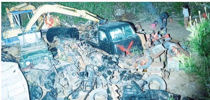
4. 《バイポーラー》よりスチル画像 2022