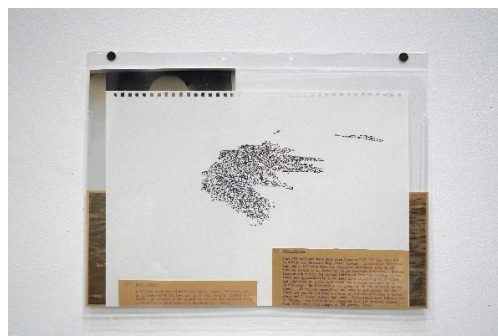
8. 《眺めの回収/風船憑依》より「アラスカ州アッツ島」 2022、紙にインク、C-プリント