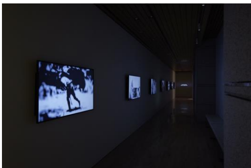
5. 藤井 光 《日本の戦争美術》2022