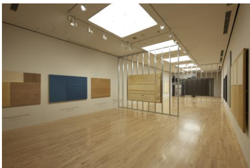
3. 藤井 光 《日本の戦争画》2022