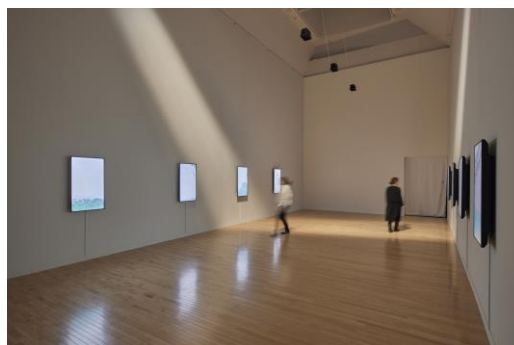
6. 山城知佳子 《彼方 (Anata)》2022