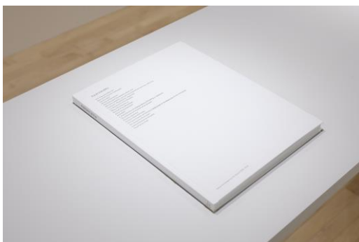
9. 藤井 光モノグラフ