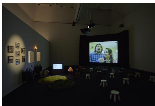
7. 山城知佳子 《チンピン・ウェスタン 家族の表象》2019