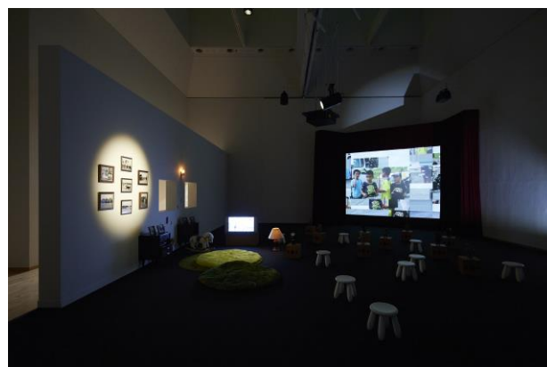
2. 山城知佳子《あなたをくぐり抜けて》（インターバル、